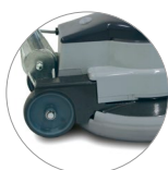
Snodo del manico