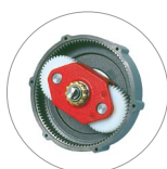
Riduttore a satelliti e planetario