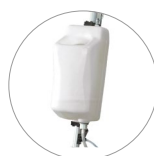
Serbatoio 9 litri